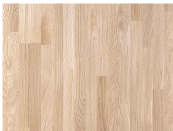
Płyty klejone z drewna litego Dąb Exclusive SW03